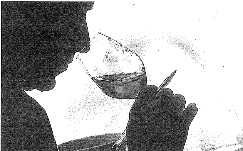
Una cata de vinos.