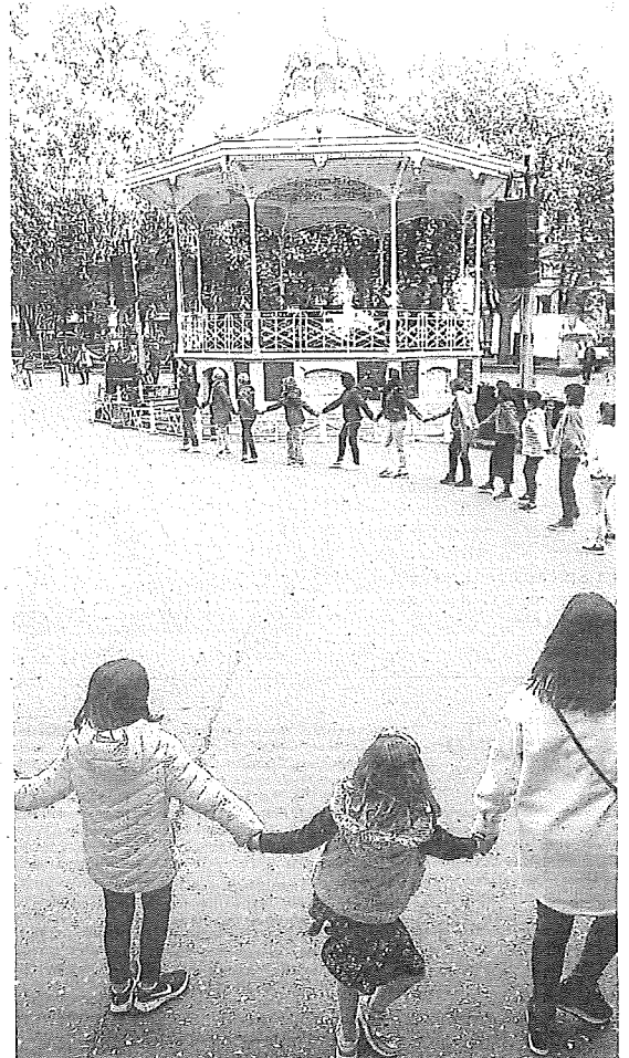
Una de las citas del año pasado.

Tras la primera cita de hoy, el programa seguirá los viernes de este mes (12, 19 y 26) para citarse con el público también el 2 y el 16 de junio. El 8 y el 15 de septiembre llegará el momento de poner el broche, siempre desde el parque de la Florida, aunque en estas citas el horario no será a las 20.00 horas, si no a las 19.30. En este camino, solo habrá una excepción en cuanto a la ubicación, la que se producirá el 9 de agosto en la plaza del Machete, en el marco de La Blanca. ●