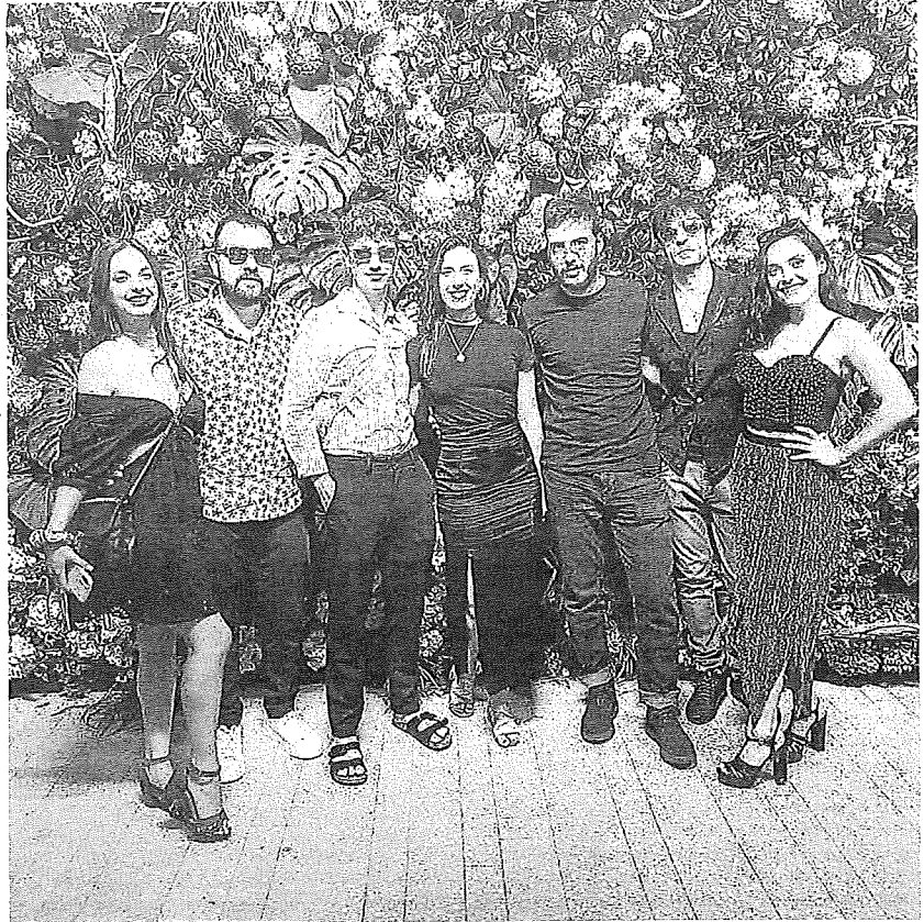
La actriz gasteiztarra junto a parte del equipo del filme en Palm Beach.

"Mi mayor ilusión sería que la gente se sintiese sorprendida en todo momento. Es un filme muy distinto a lo que estamos acostumbrados. A cada momento están pasando cosas, y espero que los espectadores sien-