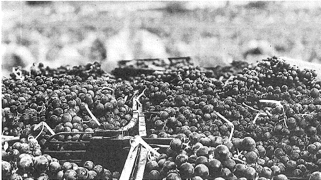
Uvas recién recolectadas en un viñedo de la Rioja Alavesa.