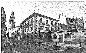
Una vista de Oion.