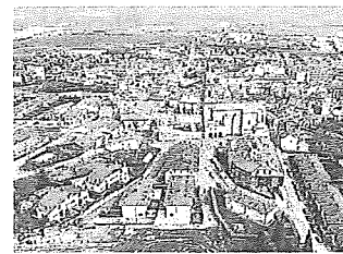
Vista de Dulantzi.

El gran damnificado por este hecho es Elkarrekin-Podemos, que tras recabar solo el 5,18% de los votos pierde el único representante que tenía en el Ayuntamiento. Los juegos de mayorías volverán a ser de nuevo impredecibles en un Pleno muy fragmentado. —C.M.O.