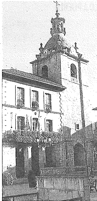
Herriko Plaza de Laudio.

Con este panorama, a EH Bildu le bastaría con la abstención de Omnia para gobernar, aunque un acuerdo a priori complicado entre los propios independientes y el PNV permitiría a los jeltzales alcanzar la mayoría absoluta —nueve concejales— que necesitaría para retener la Alcaldía al no haber sido la primera fuerza política. —C.M.O.