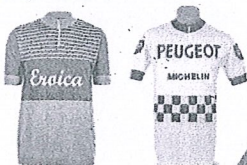
Los maillots tienen que ser de lana

L'Eroica Hispania es un evento para los ciclistas que usan bicicletas históricas o vintage. Los participantes tienen que vestir de época con maillot clásicos. Algunos optan por diseños personalizados pero manteniendo el aspecto retro.