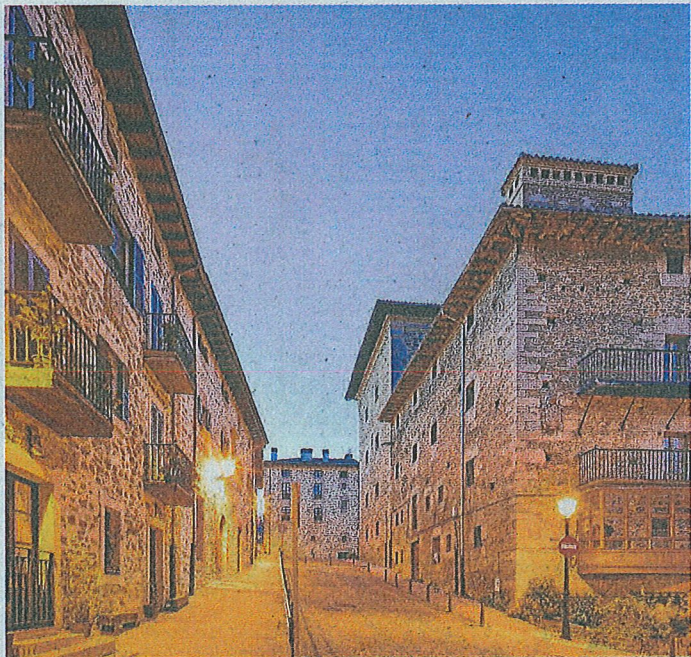
Recorre las calles medievales de Artziniega.

VIII de Inglaterra), y que es un claro ejemplar de la arquitectura renacentista en Euskadi.