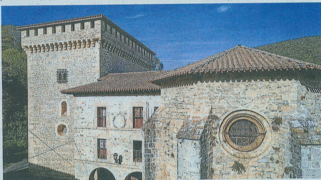
Iglesia de San Bautista en Quejana.

Pero, además de su pasado medieval, Vitoria-Gasteiz ofrece vestigios de otras épocas como palacios renacentistas, casas barrocas, edificios decimonónicos e incluso arquitectura de vanguardia. Destacamos el Palacio de Escoriaza Esquivel, que perteneció a Fernán López de Escoriaza, (médico del Rey Enrique