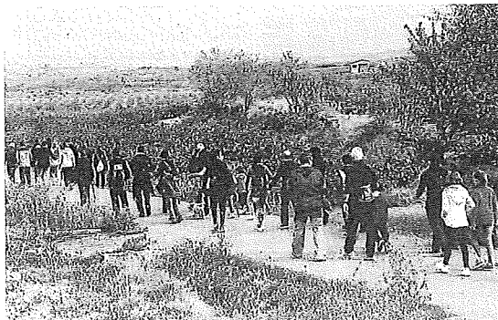
Senderismo entre viñedos en Rioja Alavesa.

ciativos. Esta localidad cuenta con una amplia representación de colectivos y se hacía necesario construir una nueva sala. De hecho el proyecto contempla la posible construcción más adelante de una segunda planta sobre la obra nueva, que tendría acceso desde la plaza que se encuentra a diferente altura.