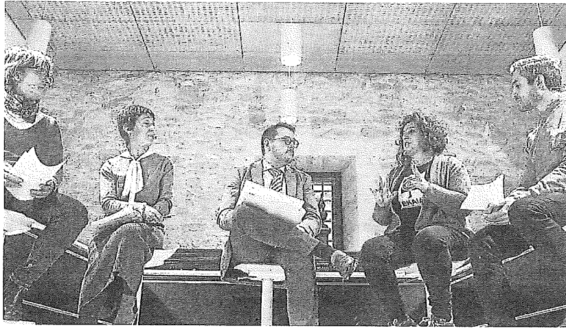
Encuentro DNA sobre comercio rural.

La mayoría de los 156 comercios beneficiarios se ubica en Vitoria-