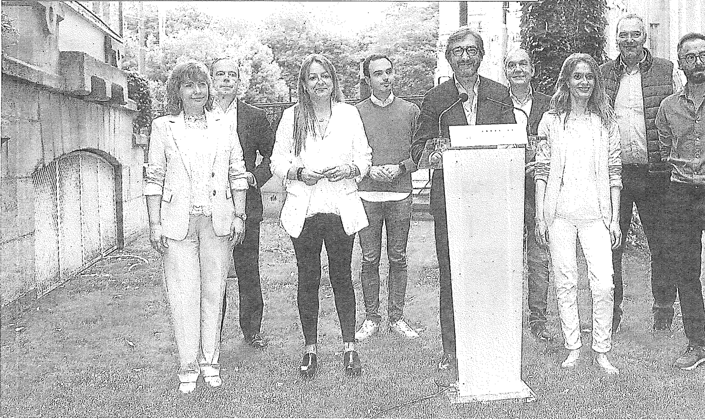
Los nueve junteros y junteras del PP, ayer a la entrada de las Juntas Generales de Álava, tras recoger sus credenciales para la nueva legislatura.