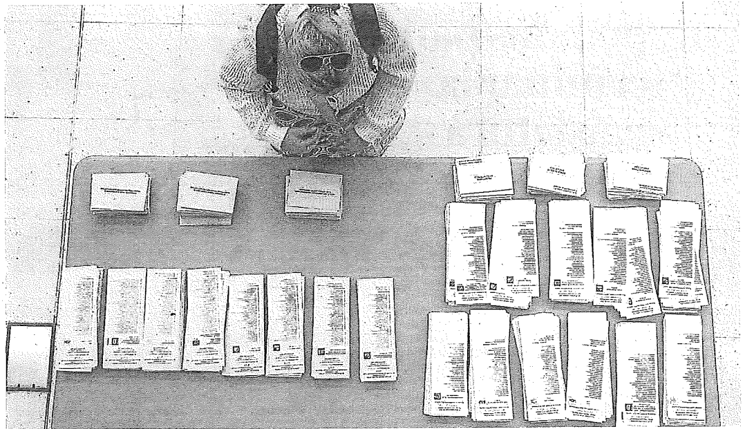
Mesa con papeletas de diferentes partidos en las elecciones municipales y forales del 28 de mayo.