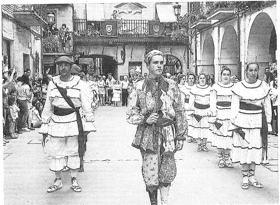
Cachimorro y los danzarines protagonizan las fiestas de San Juan de Laguardia.