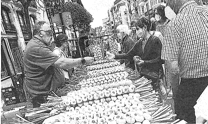
La Feria de los Ajos del pasado año.

La Policía Municipal dirigirá los vehículos de vendedores y vendedoras desde el parking del pabellón Fernando Buesa Arena