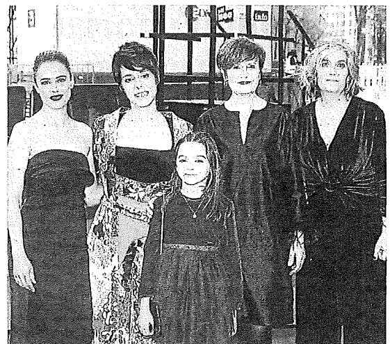
Directora y actrices en la Berlinale.