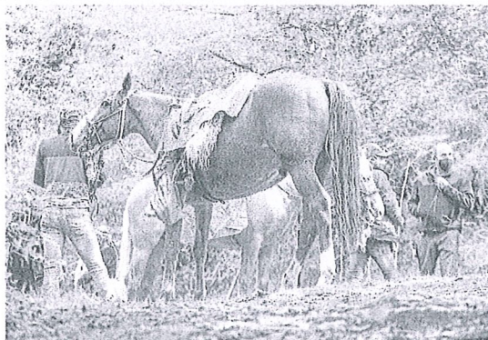
'Irati'ren filmaketaren irudi bat.

lako filmik egiten. Nilk, ordea, maite dudana egiten dut. Oso genero 'esparrukoa' dela esan daiteke, baina publiko guztiari zabaldu nahi nion mundu hau. Hala ere, eta beste alde batetik, baneukan