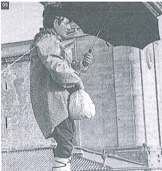
05. Tripafina, de Dulantzi.