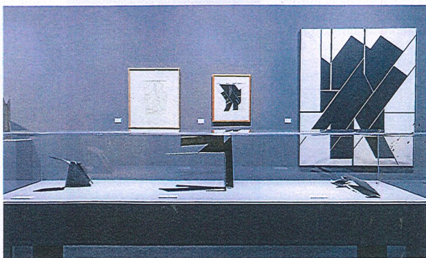
Imagen de la exposición "Método Geométrico", en el Museo Universidad de Navarra, del pintor y escultor Pablo Palazuelo. Algunas de las obras de este artista, referente de la abstracción, no se habían mostrado hasta ahora.

creativo. Para abordar este planteamiento, el comisario Gonzalo Sotelo, se sirve de 130 pinturas, esculturas y obra gráfica, así como bibliografía y documentación. La colaboración entre el propio museo y la fundación que custodia el legado del artista propicia, además, la exhibición de piezas no mostradas, hasta ahora.