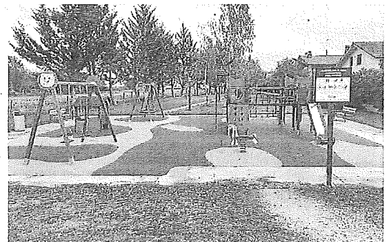
Imagen del parque de Gurutziturri reformado.

Juegos variados como el circuito de rocas , la serpiente sinuosa , el cementerio de troncos , la espiral , la carrera de obstáculos o el castillo de troncos en donde los más pequeños pueden ejercitar el equilibrio y la psicomotricidad. También se ha construi-