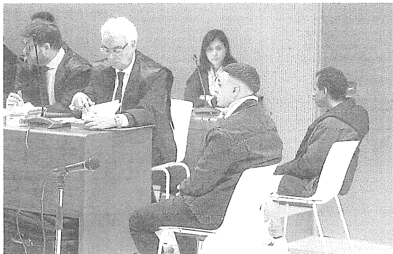
Dos de los encausados, antes de declarar y pedir perdón a las familias de su víctima. JUAN HARIN

En la fecha del crimen, ambas menores estaban tuteladas por la Administración regional y se encontraban deambulando por la calle en un momento en el que existían restricciones de