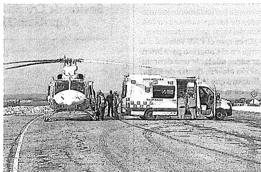
Evacuación del esquiador que sufrió un infarto. ALBO

A las 8.00 horas de ayer la temperatura en la estación era de 7 grados positivos, mientras que en el valle había solo 1