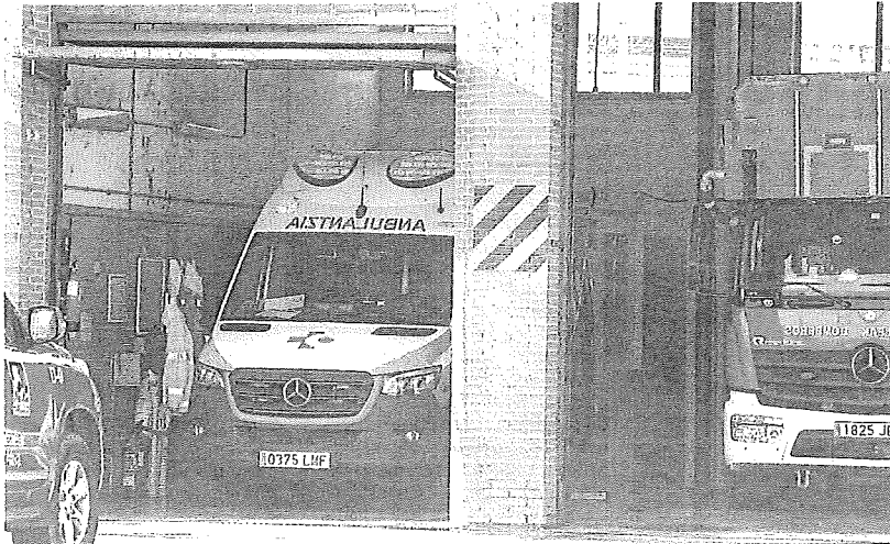
La UVI móvil de Llodio realizó su tarea sin contar con personal médico, solo de enfermería. s. ESPINOSA