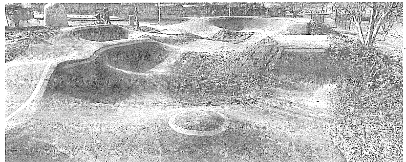
Pista de 'pump track' en Llodio similar a la que se construirá en Oion.