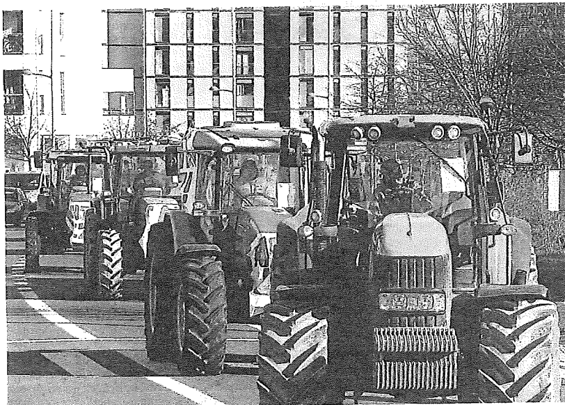
Concentración de agricultores en la capital para protestar contra la alta velocidad en 2018.