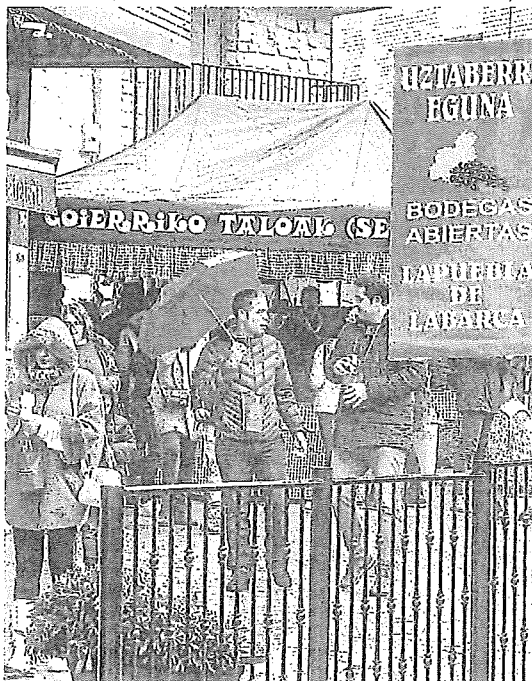
Varios asistentes disfrutaron de las bodegas abiertas de Lapuebla. E. C.

vinos de la última cosecha en los diferentes puestos en las bodegas se procederá a servir la comida popular, que tendrá un coste de cinco euros, en una carpa ubicada en la ikastola de Lapue-