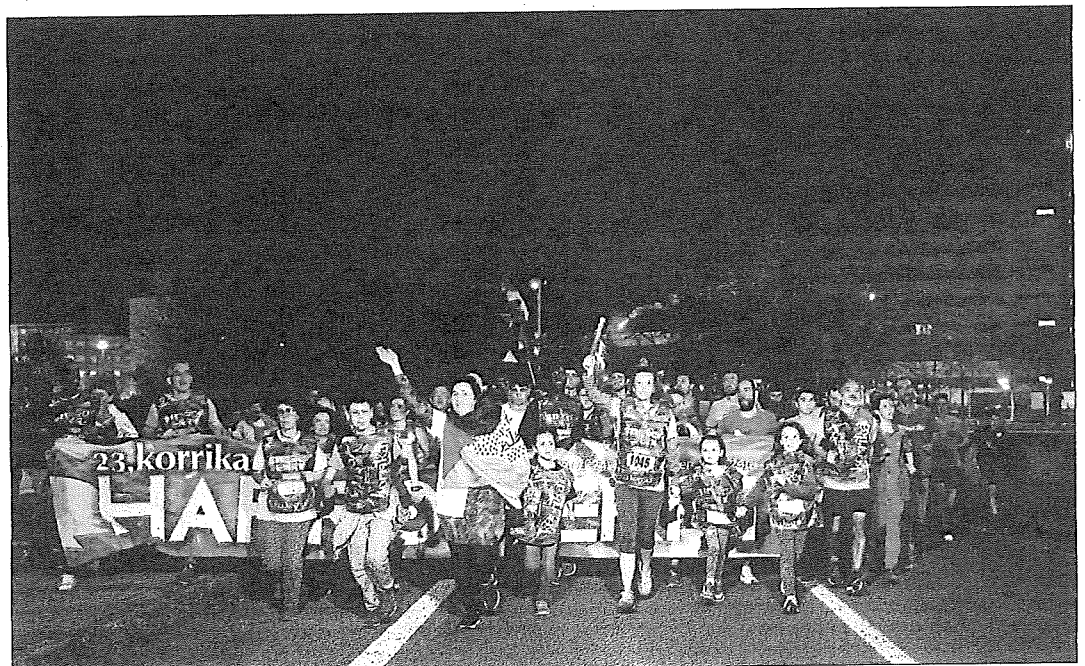
Jendetza bildu zen Arabako hiriburuan zehar, beste aldarrien artean, euskararen alde.

Muinotxo txikiak dirudite Arabar Errioxa eta Mendialdeko herriek. Aldapan diren kale estu eta zirikituz beterik daude. Eta horrek zailtasunak gehitzen dizkio berez konplikatua den Korrikari. Dena konpon liteke, ordea, jarrera baikorra bada. Hala gertatu zen Urizaharran. Erdi Aroko hiribildua XIII. mendean sortu zen, eta garaiko ondare guztia mantentzen ez bada ere, harreresiko hego atariak zutik dirau. Arku horretatik igarotzeko erronka zaila zuen Korrikak, eta plana ongi prestatuta zuten antolatzaileek.