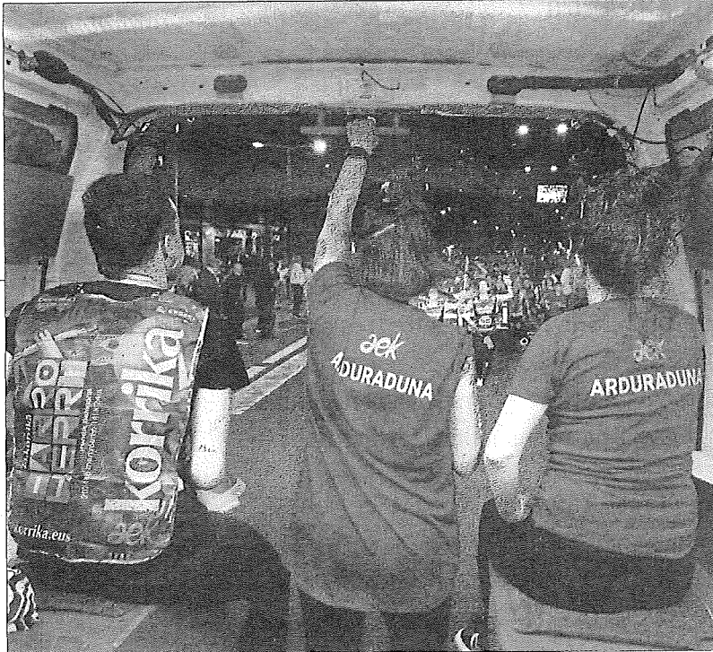
Eguraldia lagun, gauez ibili zen Korrika Gasteiztik.