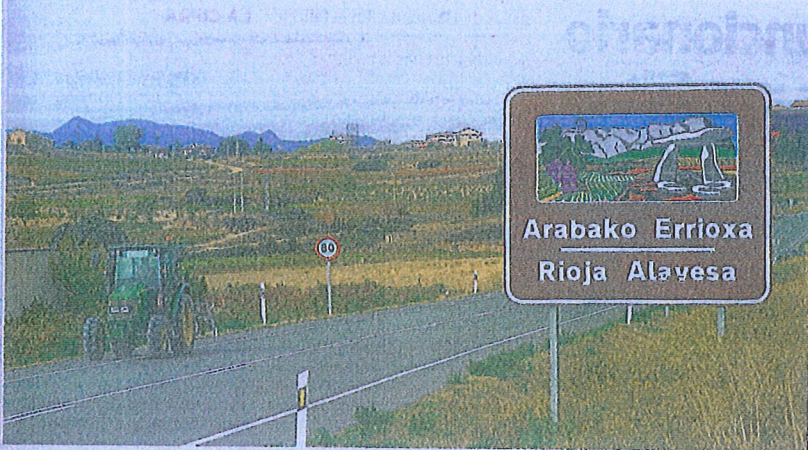
Cartel anunciador de Rioja Alavesa cerca de Labastida. IGOR AIZPURI