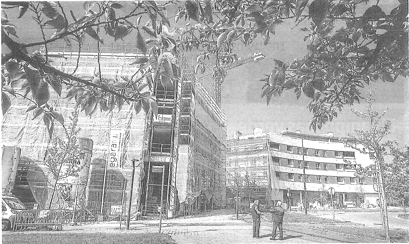
Amurrio avanza en la construcción de las viviendas sociales ubicadas en el área de Federico Barrenegoa y espera adjudicar pronto las 42 situadas en el bloque de la derecha. IÑAKI ANDRÉS