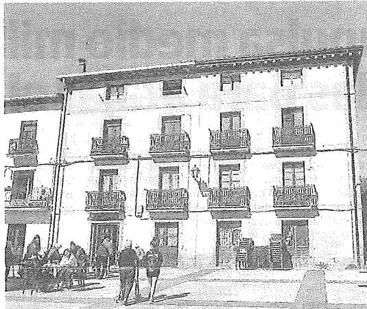
La antigua casa de la familia Urigoitia en Asparrena se rehabilitará. e. c.

La última promoción de vivienda pública que ofreció el Consistorio de Llodio, la urbanización de Apaloeta, se entregó en 2011 con 174 pisos protegidos y otros 29 sociales en régimen de alquiler. Ninguna política más en los siguientes trece años. Para aca-