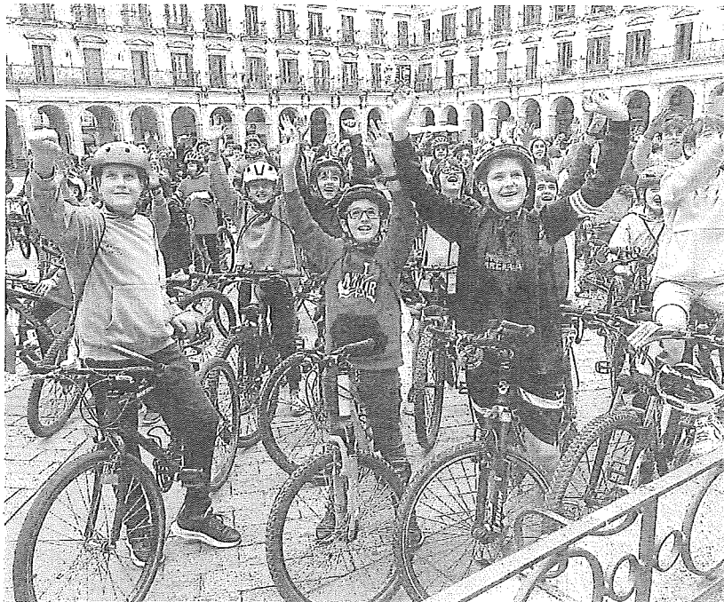
Escolares de distintos colegios de Vitoria se sumaron ayer al Día Mundial de la Bicicleta.

En lo que a los aparcamientos respecta, indicaba que la capital alavesa alcanza casi las 1.000 plazas seguras y un total de 15.412 estacionamientos en plena calle. Por todo ello, Artolazabal invita a los gasteiztarras a moverse en este medio de transporte “limpio y saludable, con enor-