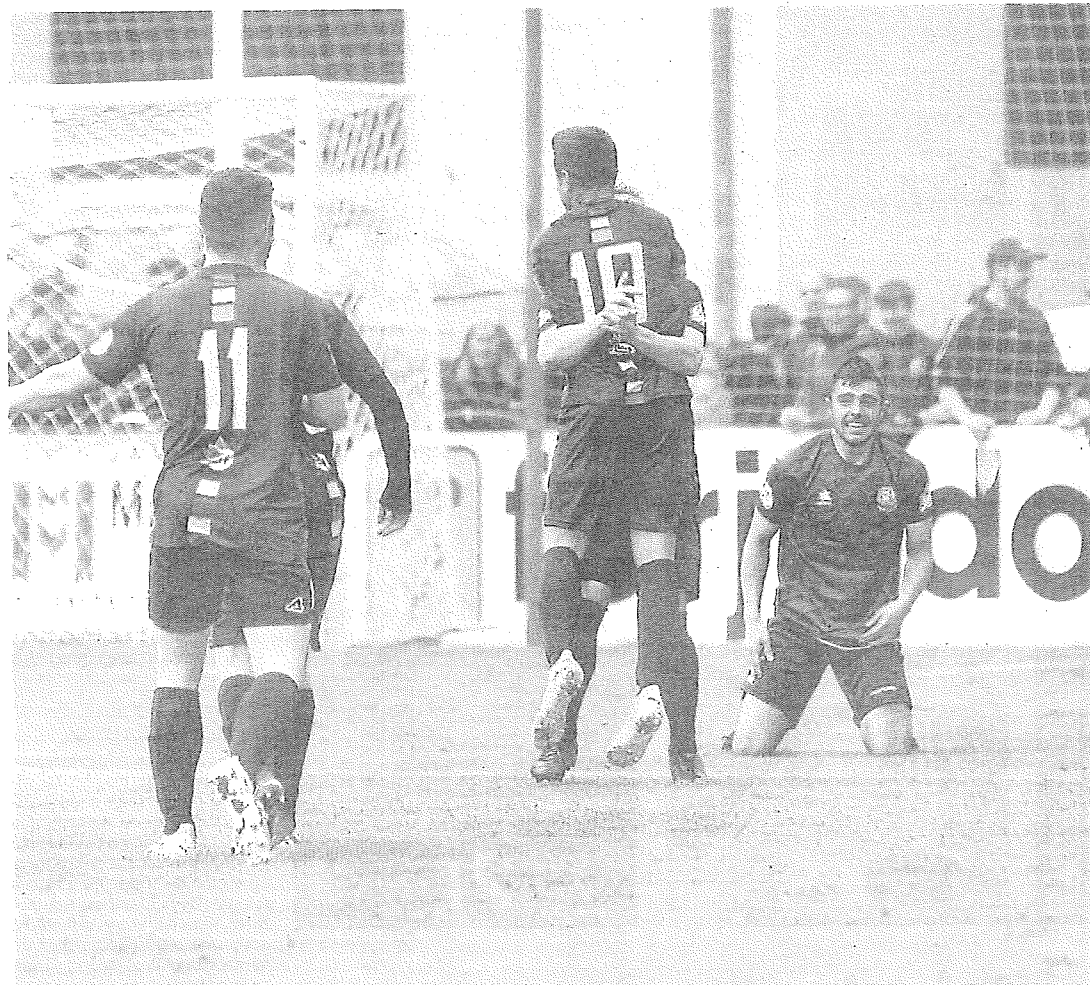
Los jugadores del Anguiano celebran su pase a la fase nacional de ascenso a Segunda Federación después de ganar en la prórroga. SONIA TERCERO