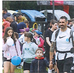
2023ko Araba Euskaraz. ALEA

Lan asko izan dira elkarlanean kudeatu beharrekoak. Horiek guztiak samurrago egin dira ikastola guztiok batuta, eta denon artean koordinatuta. Guztioren artean egin dugun auzolan honi esker, ikastolen