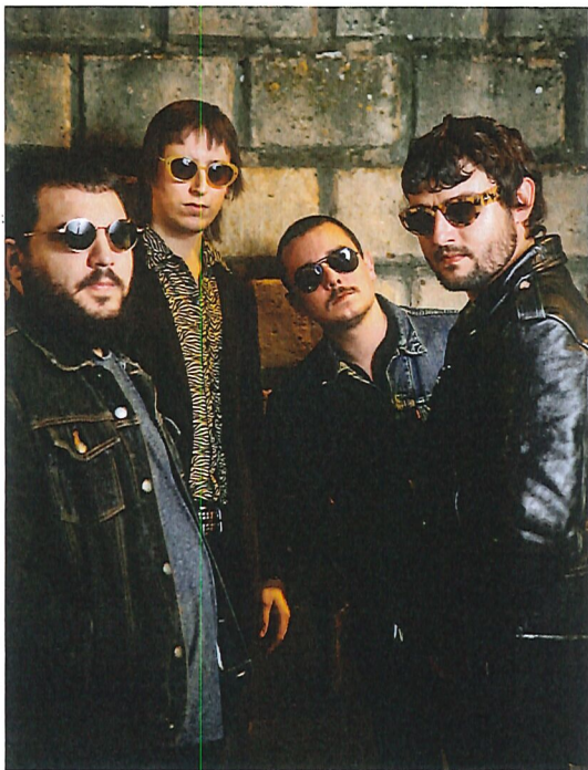
Lau kidek osatzen dute Eh Mertzke! taldea. EH MERTZKE!