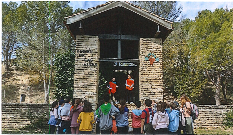
Herrian zortzi gune aukeratu zituzten anfitrioiak bisitariari erakusteko. Horieta bat, Mahastietako Andre Maria basiliza.