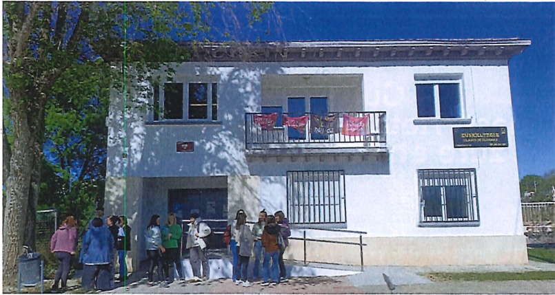
Gaur egun, 150 bat helduk jasotzen dituzte euskara eskolak Arabako Errioxan IKAREN eskutik. ARABAKO ERRIOXAKO IKA