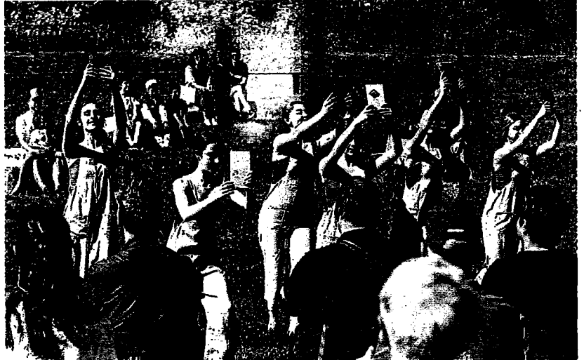
Inauguración. Número musical de las alumnas del conservatorio José Uruñuela, en el primer acto de la mañana.