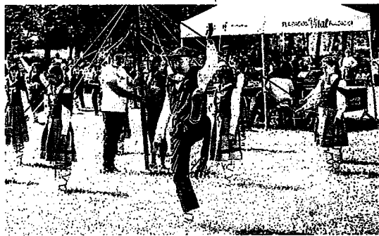
Madrugadores. Las dantzas fueron uno de los números más aplaudidos durante la cita euskaltzale.