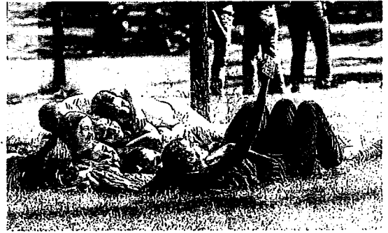
Para enmarcar. El buen tiempo acompañó durante toda la jornada con temperaturas por encima de los 30 grados.