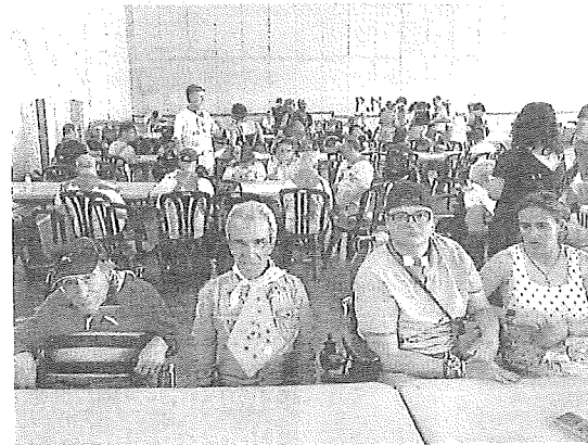
Durante la fiesta se organizó una comida popular. I. AIZPURI

«Es un día en el que ellos son los protagonistas de la fiesta. Lo viven con mucha emoción»