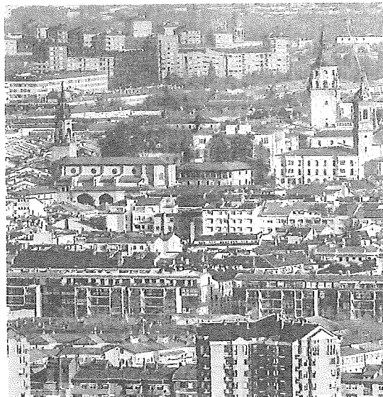
Vitoria asume la mayor de los números rojos alaveses.

mo. En esta edición de la lista de los más 'pulcros' en lo fiscal han conseguido entrar Okondo y Llodio y ha salido Legutio. Entre los que se mantienen con deuda viva cero se encuentran algunas localidades que no son precisamente pequeñas: es el caso de Amurrio, la tercera más populosa de la provincia. En la vecina Bizkaia, solo 41 de sus 112 municipios pueden presumir de no tener déficit.