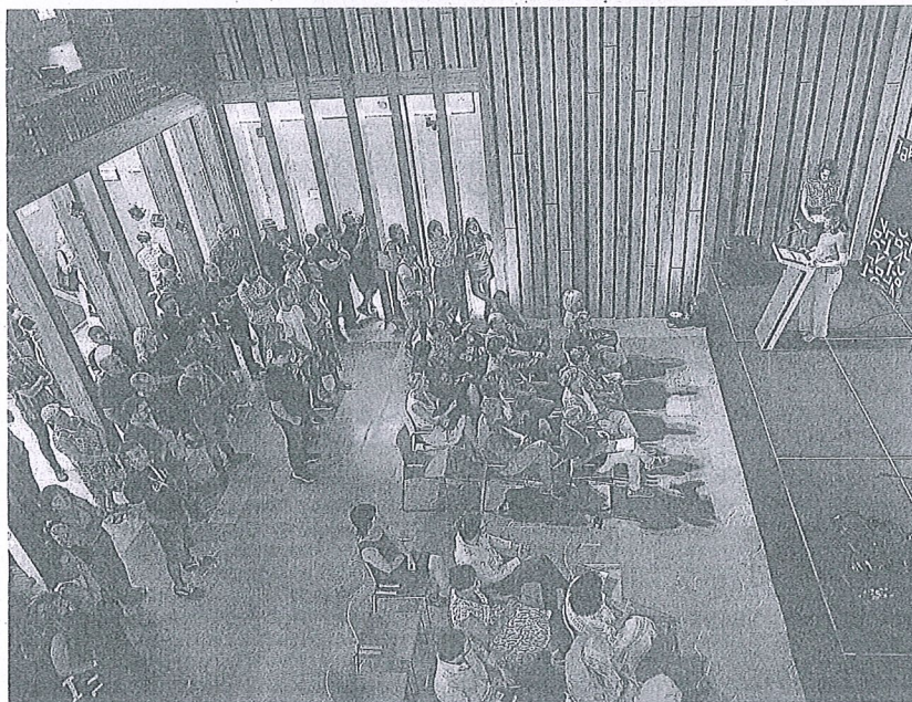
Un momento de la apertura del nuevo espacio de la calle Herrería.

GARRASTATXU - El entorno natural de la ermita de Garrastatxu en Baranbio va a perder este sábado su habitual tranquilidad. De dos años a esta parte, se ha convertido en el espacio de acogida de una cita musical solo apta para las y los amantes de los sonidos más extremos, que han encontrado aquí un escenario idóneo para disfrutar de sus géneros del metal favoritos. Se trata del True Baranbian Massakre Fest Open Air que, desde las 16.00 horas, acogerá a Ur, Lord Bakartia, Bloody Brotherhood, Enfermo, Legalize Murder, Voidesc, Casio, Peedoh, Container y Psilocybe. Cada asistente, después de la cita, decidirá qué cantidad aporta a modo de entrada. -A.O.