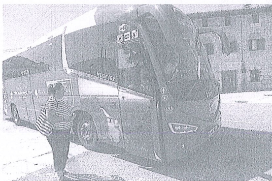
Una mujer espera a subirse a un autocar de AlavaBus.

VITORIA. Más frecuencias para el servicio de autobús entre Vitoria y Logroño a partir del 1 de agosto. La línea 9 de AlavaBus sumará cuatro viajes por sentido de lunes a viernes y hasta seis más en los fines de semana para tratar de cubrir la creciente demanda que se ha registrado en los últimos años. Asimismo, se va a recuperar durante el calendario estival los recorridos a través de la Montaña Alavesa, que incluirán paradas en Peñacerrada, Bernedo, Yécora, Oion o Ventas de Armentia. Se trata de un trayecto que también tiene cierto interés