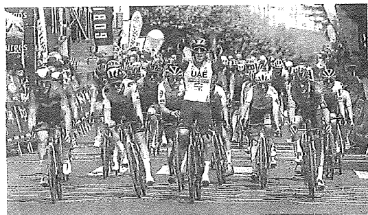
La Vuelta a Burgos pasará por primera vez por el enclave. e. c.

«No parece de ninguna manera una mera prueba deportiva, es un acto político y reivindicativo de la pertenencia a Burgos», critica en un comunicado la asociación al referirse al eslogan 'Enclave de Burgos', con el que ha bautizado la organización ese cierre. «Nos sorprende que la propia administración de un terri-