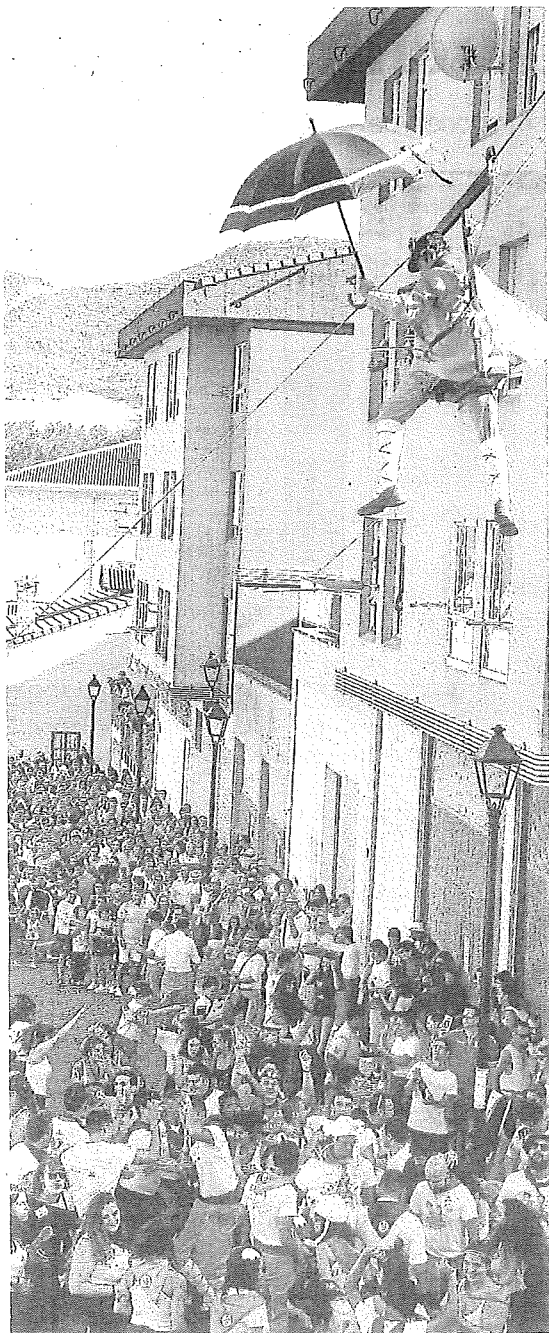
La bajada del 'Brujo' en Nanclares de la Oca.

Las fiestas de La Blanca terminan en un agosto a reventar de fiestas en el territorio. Amurrio o Nanclares y otros como Oion y Llodio celebran sus fiestas grandes este mes, así que, los alaveses van a poder seguir disfrutando