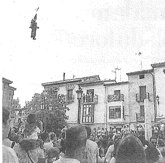
El Katxi regresa a Oyón.

En Llodio el pregón anunciador de las fiestas será el 14 miércoles a las