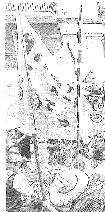
Multitud de jóvenes en las fiestas

cargo de LAPSVS y la apertura de txosnas. Los siguientes días tendrán actividades infantiles, gastronómicas como la paellada popular, las dianas y pasacalles. Además de eventos deportivos como pelota, concierto a las 20.30 horas en tributo a Joaquín Sabina y ya por la noche el Drone Light Show, verbena con Kresala y discoteca a cargo de Rosa Mari el día 15. El 16 la comida popular del pueblo con charanga incluida, concierto de Puro