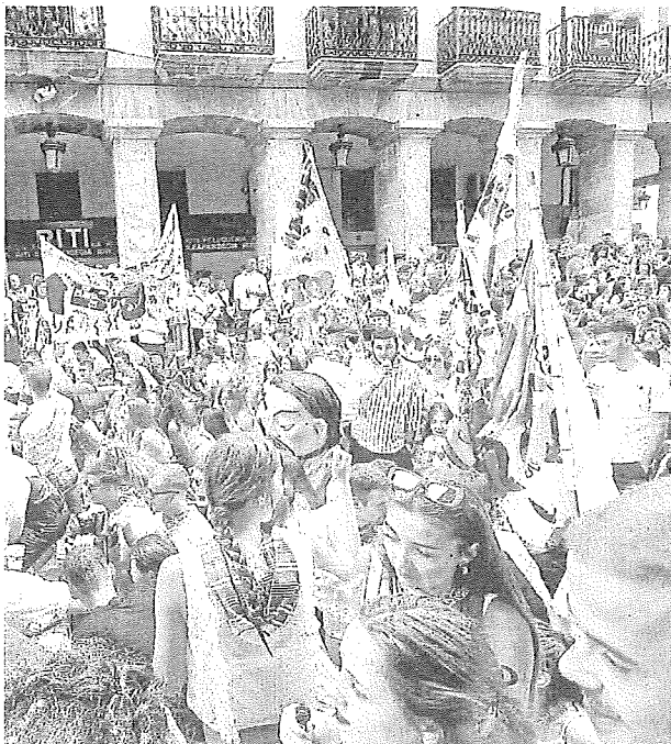
de Llodio.

●●● Servicio gratuito. El Ayuntamiento de Laudio ha puesto en marcha un servicio de autobús gratuito en fiestas, para que las y los vecinos de las localidades cercanas como Orozko, Artziniega y Respaldiza, puedan disfrutar del txupinazo y del Día de las Morcillas, 15 y 23 de agosto, respectivamente. Se trata de un servicio que contará con dos autobuses que realizarán un viaje de ida y otro de vuelta. Uno hará el trayecto Orozko-Laudio, y el otro Artziniega-Respaldiza-Laudio. De esta manera, el 15 de agosto el horario de salida de ambos servicios será a las 11.00 horas, mientras que la vuelta esta prevista para las 22.00 horas. Por su parte, el 23 de agosto, los autobuses partirán a las 20.00 horas y volverán a las 06.00 horas de la mañana. Todos los autobuses pararán a la altura de la rotonda de Eroski en Laudio; en los puntos de partida las paradas serán la Plaza Garay en Artziniega (junto al Ayuntamiento), el exterior del restaurante Toboso en Respaldiza, y la estación de autobuses Hegoalde en Orozko. Las reservas se podrán realizar a partir de hoy, por teléfono a través del SAC (94 403 48 00). El aforo será limitado. -A. Oiarzabal