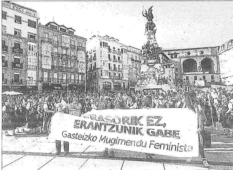
Concentración celebrada ayer en Gasteiz contra las agresiones sexistas.

Según detalló ayer la Ertzaintza, la agresión se produjo el pasado martes, día 6, después de que la víctima y el