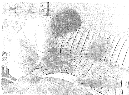
La Diputación presta el Servicio de Ayuda a Domicilio.

puesto muchísimo mayor al resto – ronda los 459 millones frente a los 28 de Amurrio o los 25 de Llodio – y una deuda viva de 86 millones, que poco a poco tiene que intentar reducir.