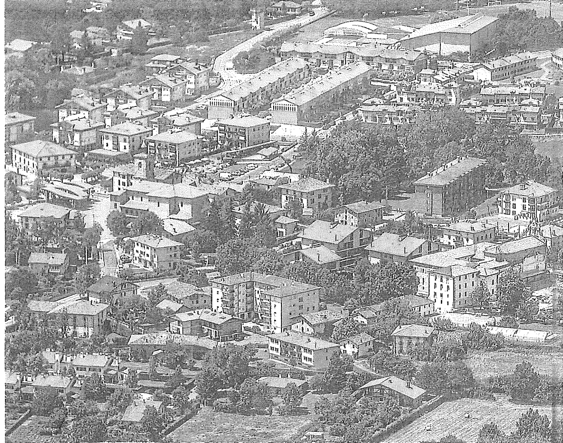
El municipio de Zuia, con Murgia como localidad más populosa, ha dejado sin gastar más de seis millones de euros en los últimos años. ac

Entre los municipios con más fondos disponibles sobresalen de Legutio y Zuia. En ambos casos han ido acumulando en los últimos ejercicios reservas superiores a los seis millones: 6,9 y 6,8 respectivamente. Y este dato es llamativo si se tiene en cuenta que sus presupuestos anuales casi se quedan en la mitad. Legutio afrontó 2023 con 3,5 millones y Zuia dispone de 3,9 para este año. En el lado positivo, todo esto quiere decir –no sólo para estos dos pueblos, sino para todos los demás– que los remanentes