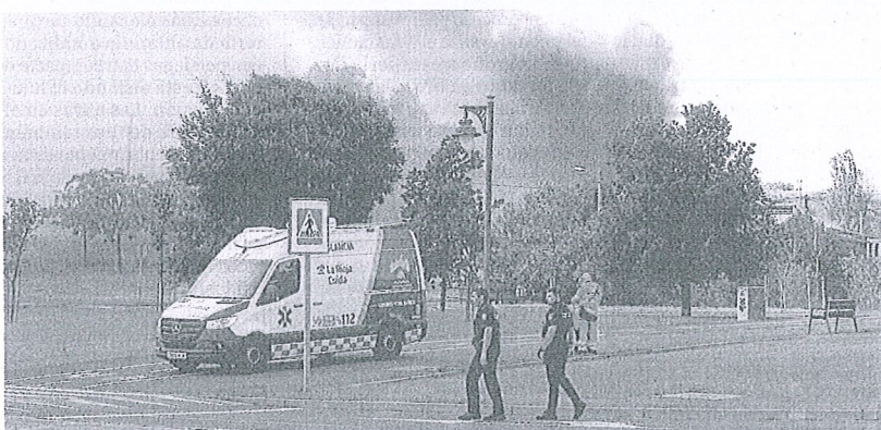
El incendio del sábado en el Camino Viejo de Oyón movilizó a recursos sanitarios y cuerpos policiales. J. MARÍN

Además de los médicos, la convocatoria, cuya inscripción a las pruebas pueden cumplimentar los interesados del 2 al 16 de septiembre, incluye en La Rioja siete plazas de residencia para enfermería –una en salud mental, dos en atención primaria y cuatro de matronas–, dos de farmacia hospitalaria y una de psicología clínica.