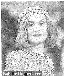
Isabelle Huppert.