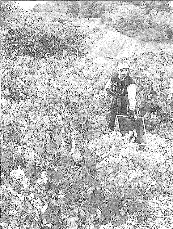
Tres temporeros trabajan en la vendimia de este año, que debido a las últimas lluvias está siendo "más adversa" de lo habitual.

radicadas en la región a fecha de 31 de diciembre de 2020, un número que ya comenzó a reducirse de forma notable un año después -108- y que experimentó una caída todavía mayor durante los 365 días siguientes, desplomándose hasta las 77 bodegas: 42 menos en solo dos años. Simultáneamente, las bodegas que apuestan por los crianzas -cuyos titulares son criadores, según la terminología del Consejo Regulador-, únicamente han perdido tres representantes durante el mismo plazo temporal, tras pasar de las 139 de 2020 a las 136 de justo dos años después. Las bodegas encuadradas en la categoría de almacenistas sumaron un integrante en Rioja Alavesa a lo largo del mismo periodo, pasando de 41 a 42, mientras que las cooperativas siguieron siendo siete, sin cambios.