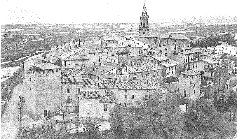
Vista panorámica de Labraza, que pertenece al municipio de Oion. D.F.A.