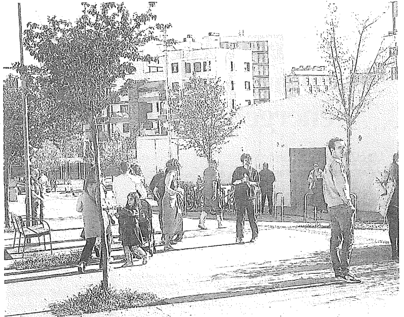
Vecinos, junto al centro cívico de Zabalzana.