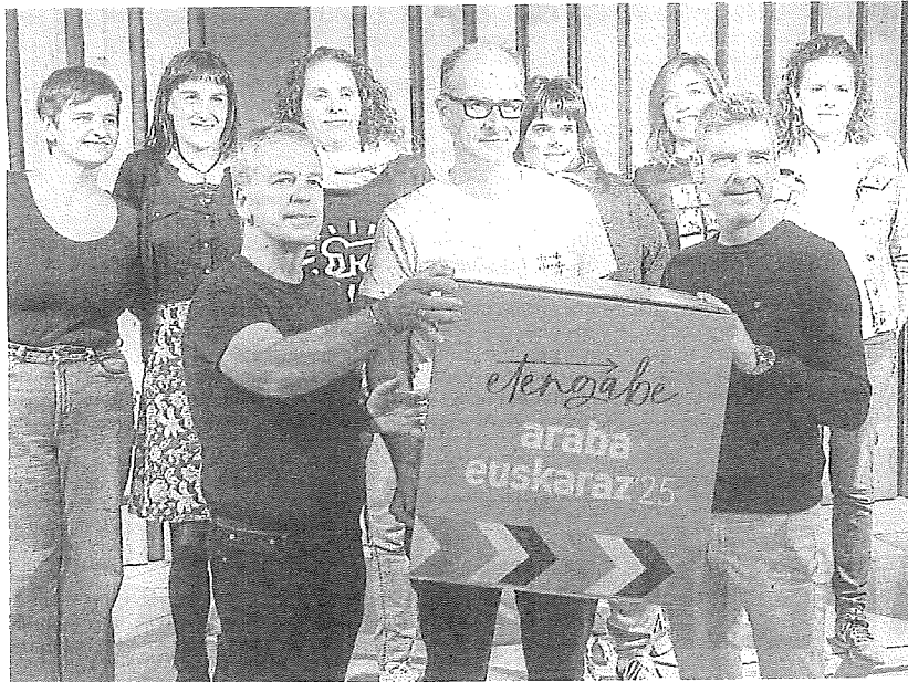
Presentación del Araba Euskaraz 2025 ayer en Vitoria.

En Labastida tendrá lugar también el Etengabe Jaialdia el próximo 17