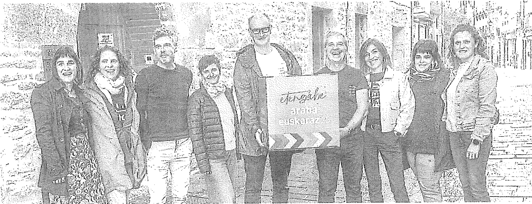
'Etengabe' (constantemente, en castellano) es el lema empleado en esta edición que cuenta con un amplio programa. B. CASTILLO