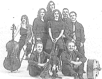
Bambú Ensemble.

El ciclo contará con tres ensambles, uno de ellos coral, dos solistas, cuatro dúos, un trío, dos cuartetos y un quinteto, acompañado de una trompeta invitada. Todos ellos, junto a las dos citas reservadas al alumnado del Centro Superior de Música del País Vasco Musikene y el Conservatorio Jesús Guridi, "forman un plantel que compagina juventud y veteranía", según Fundación Vital. Interpretarán piezas de compositores clásicos como Schubert, el más repetido, Haydn,