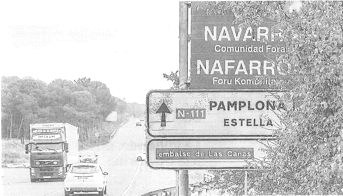
Frontera de las comunidades riojana y navarra, a escasos kilómetros de Logroño.

quierda de la ribera es mucho más pujante que la orilla derecha. De los diez municipios más ricos de la zona, ocho son navarros y tres superan los 14.000 euros de renta por habitante: Mendavia, Azagra y Cadreita. Los tres más pobres, sin embargo, pertenecen a la Comunidad Autónoma de La Rioja: Pradejón, Aldeanueva de Ebro y Ausejo, que ni siquiera llega a los 10.000 euros. Diecisiete kilómetros en coche y cuatro mil euros por cabeza separan Aldeanueva (2.700 habitantes) de Azagra (3.700).