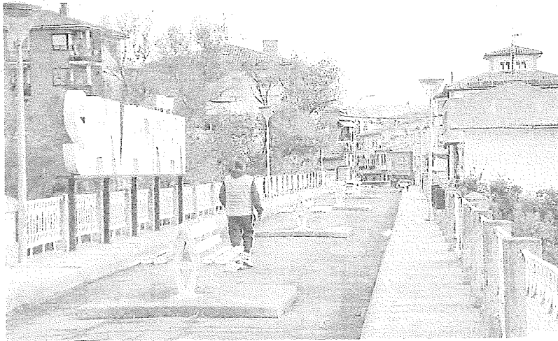
Un hombre pasea por el puente de San Adrián, en el límite con La Rioja, en una imagen de esta semana. i. A.

Para extraer estos datos, el Instituto Nacional de Estadística utiliza los registros tanto de las Haciendas forales como de la Agencia Tributaria y los cruza con los el Fichero Precensal de Población. No se trata, por lo tanto, de una encuesta, sino «de una operación basada íntegramente en la explotación de registros administrativos», explica el INE.