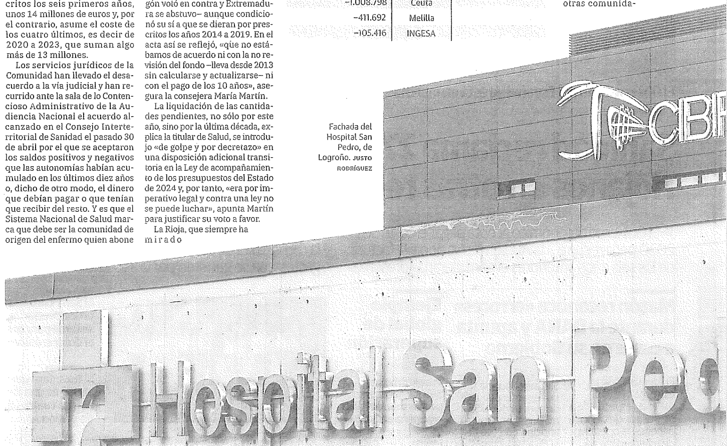
Fachada del Hospital San Pedro, de Logroño. JUSTO RODRÍGUEZ

El acuerdo al que llegaron las autonomías durante la reunión de abril es que si no se realizaba el pago voluntario de las deudas, el saldo se retendría de la financiación que recibe cada una de ellas. Aún así, uno de los problemas a los que se enfrentan las regiones es que los gastos no siempre son cubiertos en su totalidad y esto lógicamente tiene que ver con que no se han actualizado ni las cantidades ni los procesos desde 2013. Ese año se suspendió el intercambio de fondos porque era necesario revisar las condiciones, los pagos y las asistencias, así como incorporar nuevos procedimientos que no se contemplaban hasta el momento. De hecho, explica Martín, La Rioja dispensa a los enfermos de otras comunida-