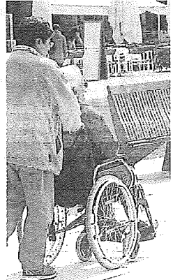
Persona en silla de ruedas.