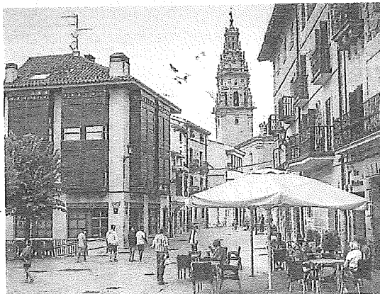
Oion contará con presupuestos en 2025 tras el pacto EH Bildu-PSE.