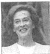
Julia Navarro Escritora y periodista