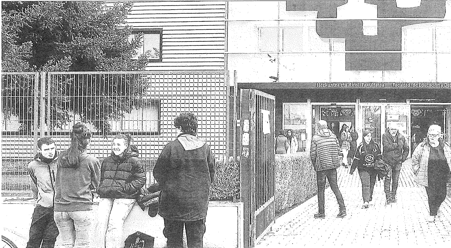
Estudiantes a la salida de la Facultad de Educación y Deporte de UPV/EHU en Vitoria.